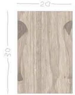
VISTA LATERALE SCALA 1:4

LEGNO MASSELLO DI CEDRO PROFUMATO O ROVERE