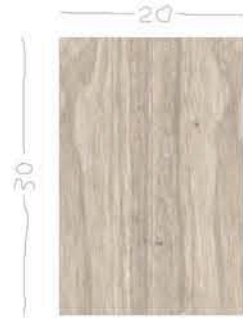
VISTA LATERALE SCALA 1:4