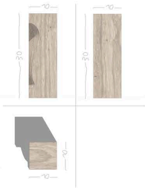
PROIEZIONI ORTOGONALI SCALA 1:4