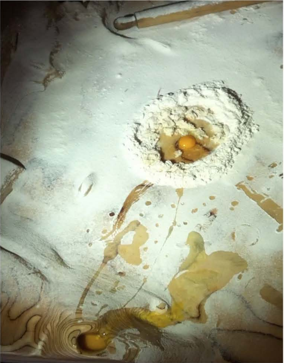
Cucina tavolo, farina, uova, mattarello