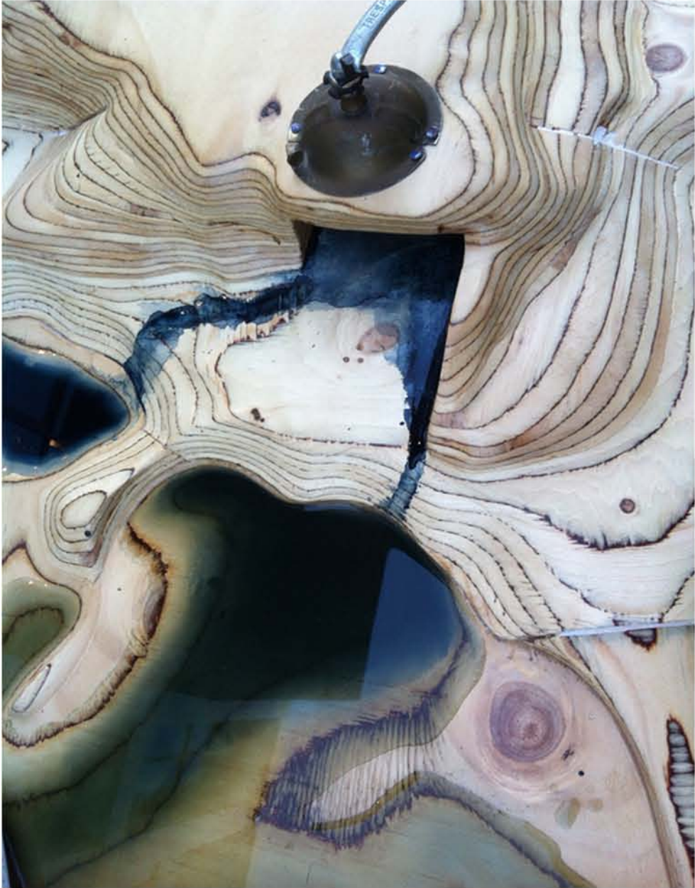
Studio Pittura, tavolo, colori, acqua